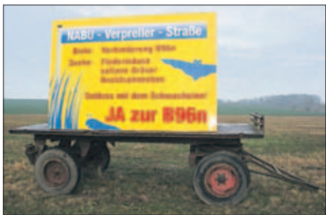
Dieses Schild steht seit gestern an der B 96n in Höhe Abfahrt Sehrow.

Wenn man den Schildern entlang der B 96 glaubt, gibt es auf der Insel mehr Befürworter als Gegner der geplanten neuen Bundesstraße. Vor Ramin nimmt uns das erste Schild „Ja zur B96n“ in Empfang. Daneben steht das „Nein zur B 96n, ja zur Umgehung“-Schild. Wenn man jedoch weiter durch den Ort fährt, folgen nur noch Ja-Schilder. In den unterschiedlichsten Variationen. Die Einwohner wünschen sich bessere Luft, weniger Lärm und ein Ende der Staus. Jetzt gibt es neue Schilder der B96n-Befürworter, eines in Höhe der Abfahrt Sehrow und eines bei Altfähr. Wobei die bislang anonymen Macher des Banners auf einem alten Wagen, einen neuen Ton anschlagen. Sie greifen die Naturschützer mit ihrer „Nabu-Verpreller-Straße“ und mit der Suche nach schützenswerten Fledermäusen, seltenen Gräsern und Nacktschnecken an und fordern „Schluss mit dem Schwachsinn! Ja zur B 96 n“. Ein deutliches Zeichen für die Emotionalität, die bei den Inselbewohnern immer mehr hochkocht, findet Ihre Katharina Degrossi