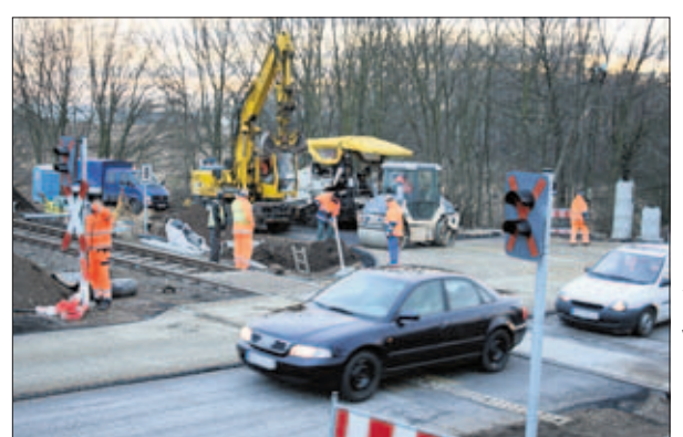
Noch bis zum kommenden Mittwoch ist der Bahnübergang Stralsunder Chaussee saniert. Dort kommt es zu Verkehrsbehinderungen.

Die Bauarbeiten sollen noch bis kommenden Mittwoch (9. Dezember) andauern. Spätestens am Donnerstag sollen die neuen Schranken dann in Betrieb gehen und sich die Verkehrsprobleme erledigt haben. Die Bahn habe auch die Polizei informiert, damit Beamte im schlimmsten Fall den Verkehr regeln können. A. M.