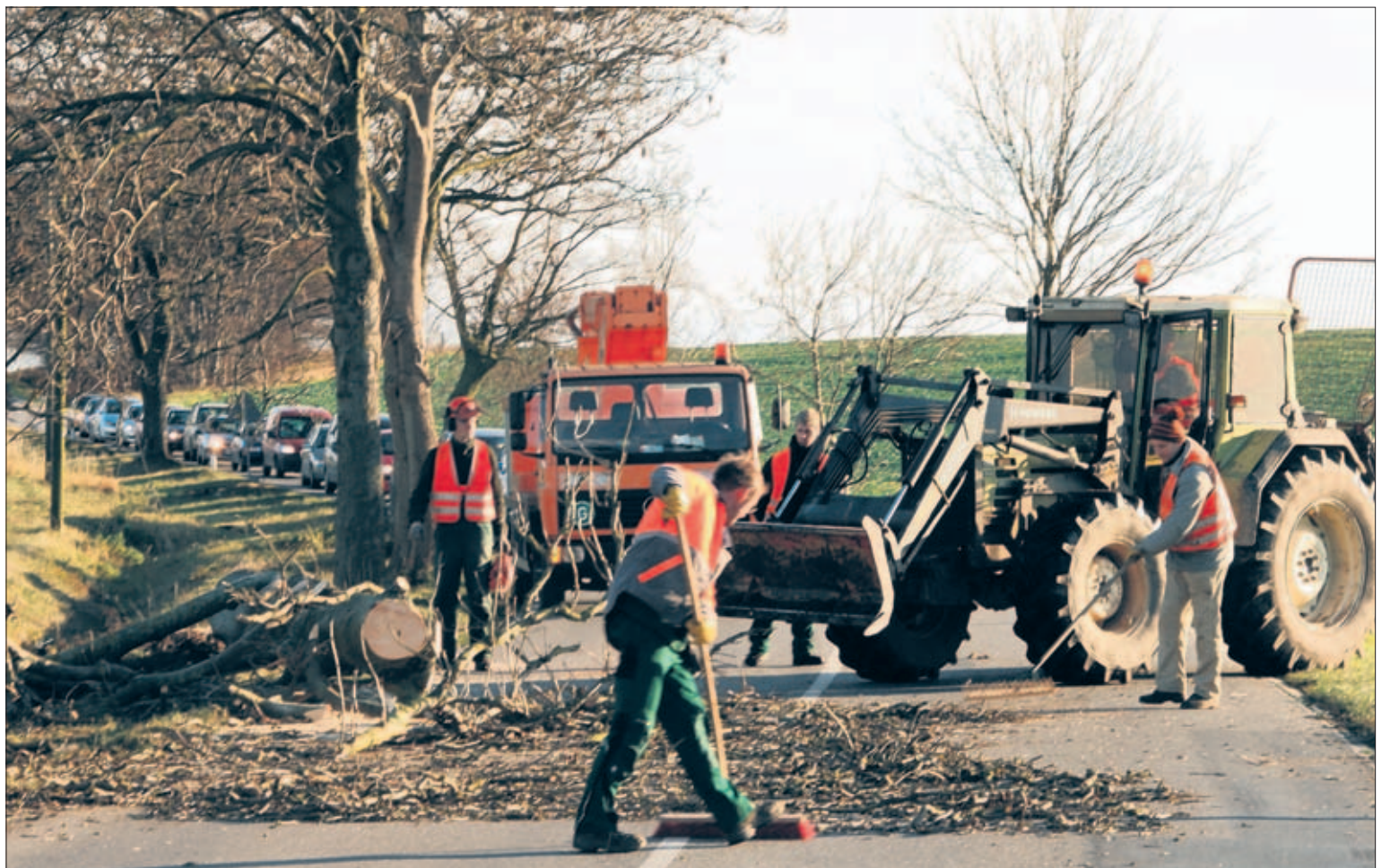
Motorsägen haben zurzeit Konjunktur in Rügens Alleebäumen. Mit schwerer Technik wird hier auf der B 196 kurz hinter Dalkvitz ein gerade gestreckter Alleebaum von der Straße geschoben. Der Baum landet komplett in den Schredder.

Die B 196 ist laut Sendrowski ein Einsatzschwerpunkt. „Da sind ganz viele Bäume krank.“ Gutachter haben bei Baumschauen festgestellt, dass sich ein Pilz ausbreitet. 60 Bäume wurden in ihrer Vitalität als stark gefährdet eingestuft. Sie werden damit zur Gefahr für den Verkehr – und müssen fallen. Baumlücken entstehen aber nicht nur an der Hauptmagistrale zur Bäderküste. An Landesstraßen werden auf der Insel 129 Bäume gefällt. An Kreisstraßen sind es 81, die der Säge zum Opfer fallen werden, kündigt Ralf Sendrowski an. Andererseits hat das Straßenbauamt in diesem Jahr auch schon für Ersatz gesorgt und unter anderem 110 Bäume zwischen Karow und Zirkow pflanzen lassen. U. BURWITZ