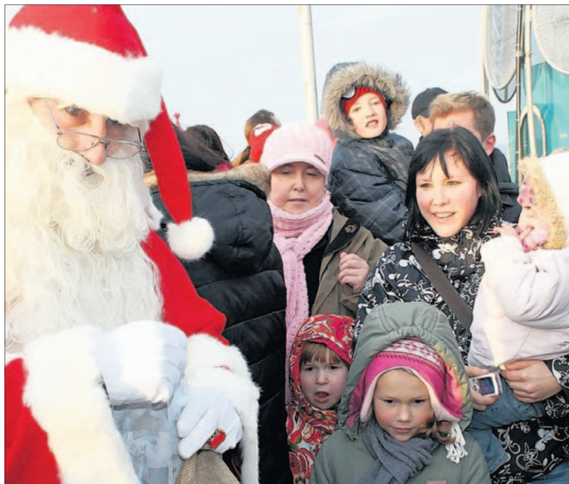
Kaum war der Weihnachtsmann mittels der Tauchgondel aufgetaucht, war er schon dicht umringt. Zwei volle Säcke mit Geschenken hatte er für die Kinder mitgebracht.

Das „Rügensche Kreis- und Anzeigenblatt“ schrieb in seiner Ausgabe vom 7. Dezember 1909: „Neukamp. Durch den Brand des Saltzhauses hat eine Fischerkommune bedeutenden Schaden erlitten, da sie die Versicherung wegen Aufgabe des Betriebes gekündigt hatte, aber die Netze noch nicht daraus entfernt hatten. Auch 2 Garnkähe sind durch das Feuer zerstört worden, der eine gänzlich, der andere teilweise. Nach der Brandursache wird nach wie vor gesucht; wer den Fischern in der entstandenen Schadenssache nun helfen kann, bleibt bislang noch ungeklärt.“