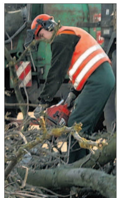
Haben auf Rügen gut zu tun: Mitarbeiter der Baumschule Indorf fällen an Bundes- und Landesstraßen kranke Alleebäume.

Info: Auf Rügen gibt es 399 Alleen und Baumreihen. Die grünen Tunnel als Markenzeichen der Insel säumen 287 Kilometer Straßen und Wege.