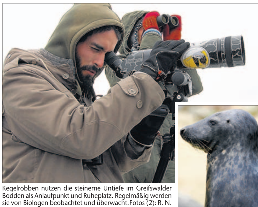
Kegelrobben nutzen die steinerne Untiefe im Greifswalder Bodden als Anlaufpunkt und Ruheplatz. Regelmäßig werden sie von Biologen beobachtet und überwacht.

Die Tour stand von Anfang an – meteorologisch betrachtet – unter keinem