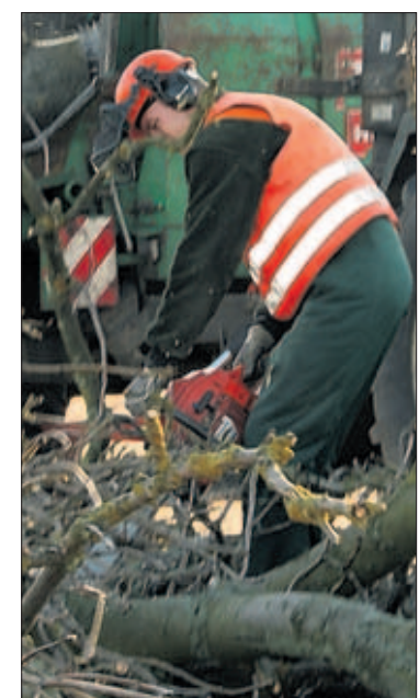
Haben auf Rügen gut zu tun: Mitarbeiter der Baumschule Indorf fällen an Bundes- und Landesstraßen kranke Alleebäume.

Info: Auf Rügen gibt es 399 Alleen und Baumreihen. Die grünen Tunnel als Markenzeichen der Insel säumen 287 Kilometer Straßen und Wege.