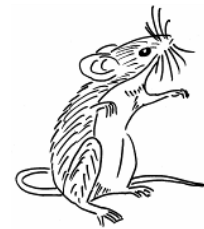
Rötel- & Gelbhalsmaus

Die Zahn- & Nagespuren verlaufen senkrecht zum Rand. Hier haben Rötelmaus oder Gelbhalsmaus genagt.